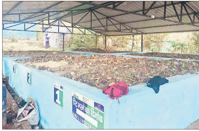
सॉलिड वेस्ट प्रोसेसिंग प्लांट।