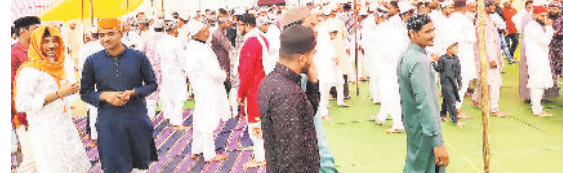
नमाज अदा करने पहुंचे लोग, ईदगाह के समीप सुरक्षा व्यवस्था में लगे जवान।

जिलेभर में ईद-उल-फितर का त्योहार हर्षोउल्लास के साथ मनाया गया। शहर में सुबह से ही मेनरोड बैकुण्ठपुर, रामपुर, जुनापारा मस्जिदों और ईदगाहों में नमाज अदा करने के लिए बड़ी संख्या में लोग जुटे। नमाज के बाद लोगों ने गले मिलकर एक-दूसरे को बधाई दी और मिठाइयों का आदान-प्रदान किया।