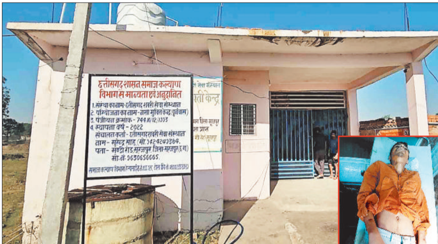
मंदिर रोड स्थित नशामुक्ति केंद्र, इनसेट में मृतक।

मंडी रोड स्थित नशा मुक्ति केंद्र में उस समय हड़कंप मच गया जब दो दिन पहले ही दाखिल हुए युवक की संदिग्ध हालत में अस्पताल ले जाते समय रास्ते में मौत हो गई। युवक की मौत हो जाने तथा शरीर में चोट के निशान पाए जाने पर परिजन ने मारपीट करने का आरोप लगाकर जमकर हंगामा मचाया। परिजन का आरोप है कि युवक को जब नशा मुक्ति केंद्र में दाखिल कराया गया था तब वह स्वस्थ था। परिजन ने मामले की जांच किए जाने तथा दोषियों के विरुद्ध कार्रवाई किए जाने की मांग को लेकर प्रशासन से गुहार लगाई है।